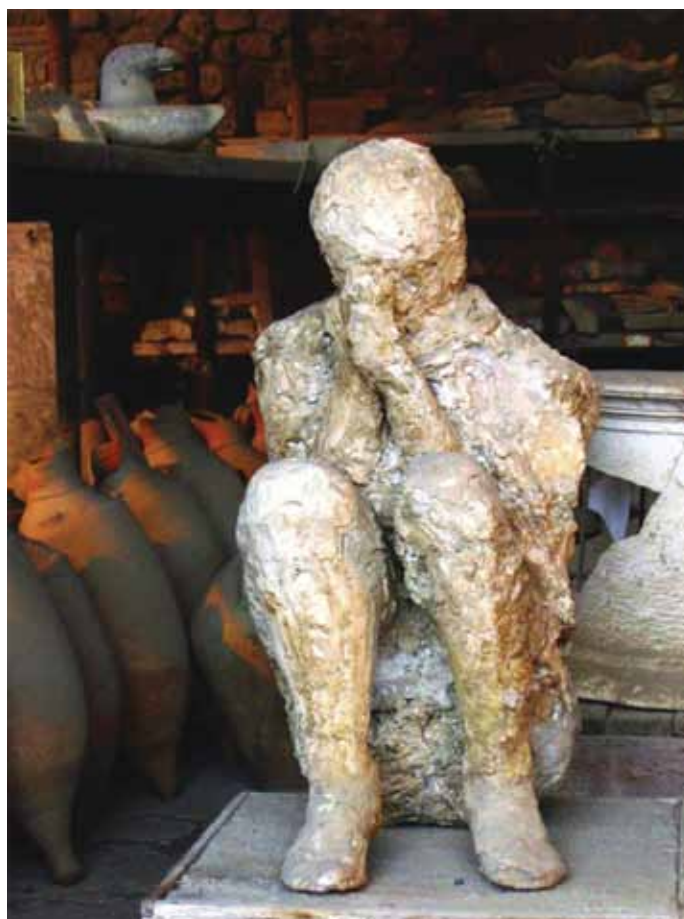
Ostaci ljudskog tijela koje je ostalo zarobljeno pod lavom

više od 25 javnih kuća, a Lupanar je bila najveća. Prostitutke su bile ropkinje uglavnom iz Grčke i s istoka, a cijene usluga jako niske, ne više od nekoliko čaša obična vina. Prostitucije je bilo posvuda, a ne samo u javnim kućama već i u otvorenim sobama s pogledom na ulicu, gostionicama i termama. Bile su opće prihvaćene te je poznato da se za vrijeme Kaligule ubirao i porez od vlasnika istih.