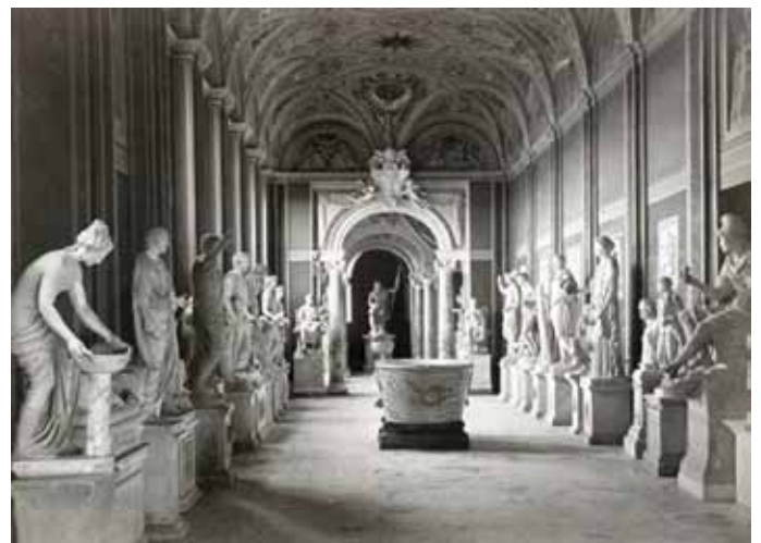
Galerija statua u muzeju Pio Clementino