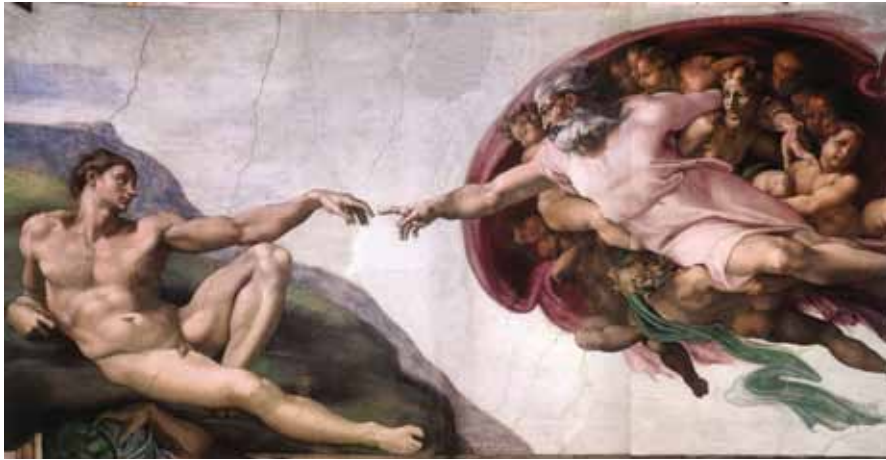
Detalj iz Sistinske kapele

Vatikanske palače su veličanstveni zbir zgrada s mnogobrojnim sobama, dvoranama, muzejima, galerijama, bibliotekama, kapelama, hodnicima, dvorištima i vrtovima, bogati svakojakim umjetničkim blagom.