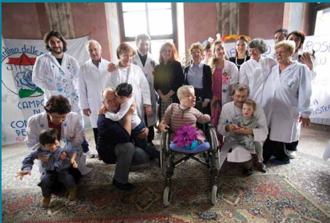
27.veljače 2012.: Veleposlanik Republike Italije u Hrvatskoj posjećuje Gornju Bistru

Razmotrite ovaj članak kao osobni poziv da procijenite kakva će biti Vaša uloga u ovoj predivnoj priči.