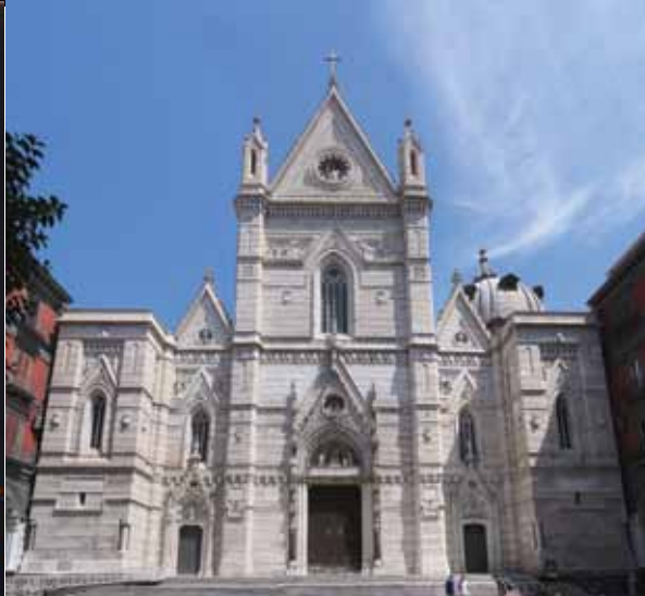
La cattedrale vista dall'esterno