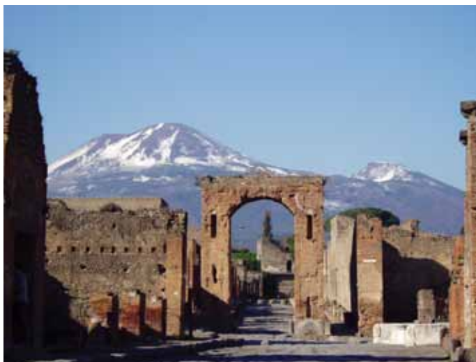
Ulaz u Pompeje