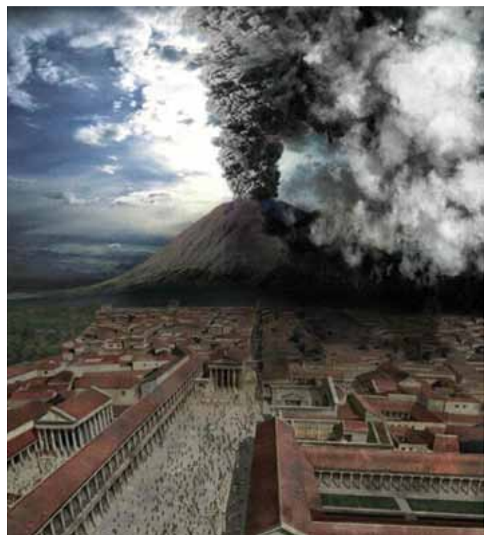
Pompei e Vesuvio

Anche se a fondare Pompei sono stati gli Etruschi alla fine del VII sec. a.C., le costruzioni più significative sono state edificate nel periodo dell'Impero Romano tra il III e il II sec. a.C. All'epoca dell'imperatore Augusto, a partire dal 20 a.C., sono stati innalzati templi in onore degli dei cari ad Augusto: il tempio di Apollo, la basilica con il tribunale, le terme del Foro, l'edificio della sacerdotessa di Venere Eumachia, il tempio di Giove, le terme Stabiane, l'Anfiteatro, il tempio di Vespasiano, così come ampie ville. Le case padronali del periodo pre-romano erano estese anche più di 3000 m 2 . Nel centro campeggiava una piscina e intorno all'atrio si trovavano le camere da letto, le sale da pranzo, le stanze per le attività quotidiane, mentre i locali accessori e la cucina si trovavano in angoli remoti della casa ed erano bui e stretti. Interessante notare che tutte le stanze avevano armadi.