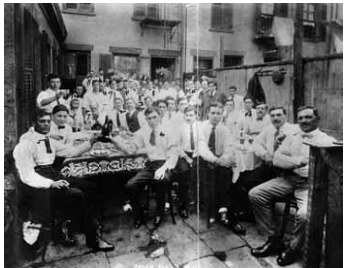
Neki od članova Camorre

Jajoliki dvorac je dobio ime po magičnom jaju koje štiti grad od opasnosti. Navodno ga je Virgilije stavio u zaključanu staklenku i sakrio u dvorcu.