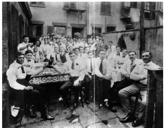
Alcuni membri della Camorra

Il Castello dell'Ovo ha preso il nome dall'uovo magico che difende la città dai pericoli. Si narra che Virgilio l'abbia riposto in una vetrina sotto chiave e nascosto nel castello.