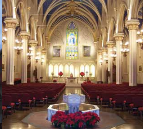
La cattedrale vista dall'interno

Il patrono della città è San Gennaro e il suo sangue a partire dal III secolo si scioglie due volte all'anno durante la santa messa in Cattedrale. Se il sangue si tramuta in liquido, sarà un anno buono, se invece non si liquefa allora qualcosa di nefasto accadrà a Napoli.