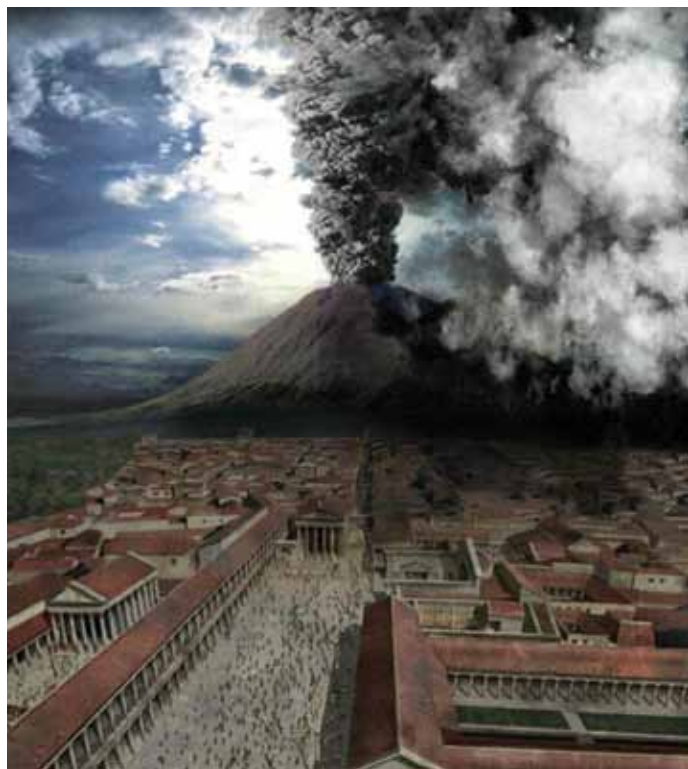
Pompeji i Vezuv

Iako su Pompeje osnovali Etruščani krajem VII. st. prije Krista, najznačajnije građevine su građene za vrijeme Rimskog Carstva na prijelazu iz III. u II. st. prije Krista. Za vrijeme cara Augusta, od 20. g. prije Krista, podignuti su rimski hramovi omiljenih Augustovih božanstava: Apolonov hram, Bazilika sa sudnicom, Forumske terme, zgrada Venerine svećenice Eumahije, Jupiterov hram, Stabijske terme, Amfiteatar, Vespazijanov hram , ali isto tako i prostrane vile . Gospodarske kuće iz predrimskog razdoblja imale su i više od 3000 m 2 . U središtu su imale bazen, a oko atrija bi se nalazile spavaće sobe, blagovaonice, sobe za sva-